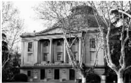
中央大学大礼堂是考点之一