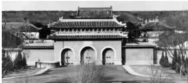
民国时期的国民政府考试院

第四试场设在门帘桥(今太平巷一带)南京中学第一院,大门同样系着彩绸,上书“人尽其才”。校内设点名处、衣物寄存室等。考生进入考点后,由监考委员一人高声点名,另由警卫高举名牌提灯引入考场。第一天考试是普通行政人员类别,应考者有一千三百余人。