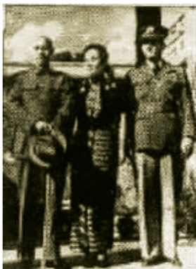
蒋介石、宋美龄、陈纳德在大校场机场 资料图