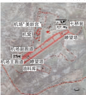
大校场机场示意图

位于南京秦淮区的大校场机场,修建于民国时期,是中国历史上最大的航空基地之一,抗战前被定为最高级别的航空总站,在抗日战争中,许多中国空军飞机从这里起飞,与来犯的日军飞机搏杀。作为曾经的重要机场,大校场也定格了不少重要的历史时刻。“西安事变”和平解决后,蒋介石夫妇乘坐的波音飞机在四架战斗机的护航下,从洛阳飞抵南京大校场机场,陪同前来的张学良在机场被扣押。解放后,大校场成为空军机场并沿用至今。随着南京城市的扩张,大校场机场搬迁早就被提上日程。