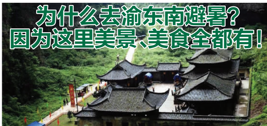
世界自然遗产——重庆武隆天生三桥