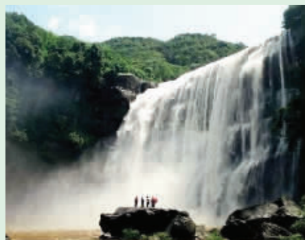
世界自然遗产——贵州赤水大瀑布

各大旅行社均可报名 同行咨询电话: 025-84798088、13270757387 直客电话: 13914768411