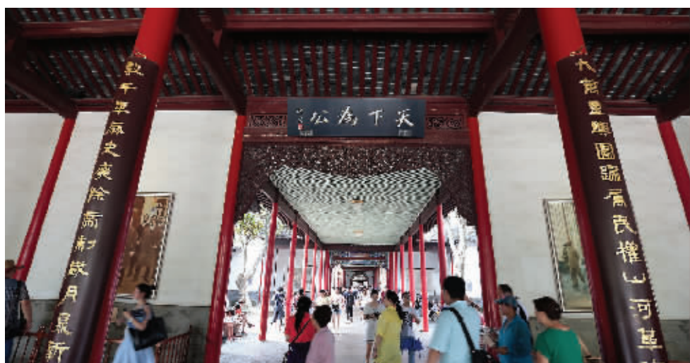
总统府大部分建筑都是木结构,防治白蚁工作尤为重要