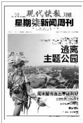
(上期星期柒新闻周刊封面)