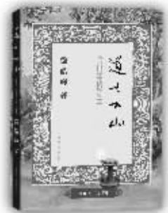
小说《道士下山》封面