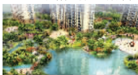
弘阳·旭日上城效果图