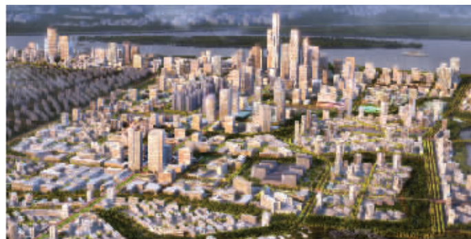
江北新区浦口中心区局部鸟瞰图

江北新区的规划发布,同样牵动着江北开发商的心,昨天上午的发布会就有两家开发商派员工参加。而在发布会之后,浦口中心区受益的楼盘继续迎来买房人,个别楼盘已经卖得快脱销。现代快报记者 马乐乐