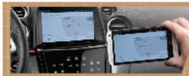
THINK+2.0智慧互联系统 | iTouch*智慧触控系统

全新ECO HYPER高效节能动力系统,有效省油18%*.ECO Mode节能模式及智能启停系统,提升燃油经济性.2.2T涡轮增压引擎,AISIN智能型6速手自一体变速箱及智能三模式4WD系统,让能量在思考中澎湃迸发.THINK+2.0智慧互联系统,实现手机与爱车的无缝连接.科技晶钻头灯组与高刚性锻造轮毂,彰显大气豪华的外观.这就是新大7 SUV,思考改变驾驶,更创造了新世界。