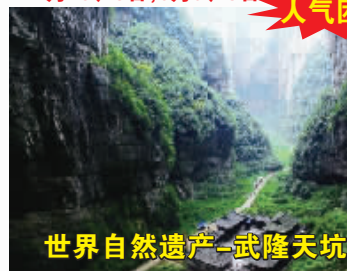
世界自然遗产-武隆天坑