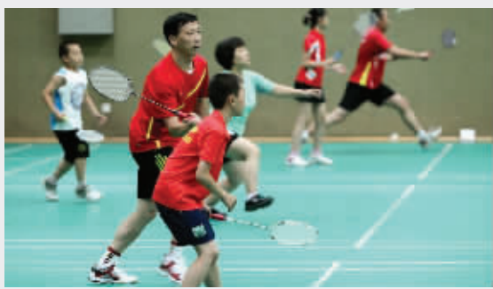
羽毛球运动深受家长和孩子的喜爱 资料图片

本届训练营是江苏省全面推进阳光体育运动的重要举措,全省少年儿童既能在活动中学习羽毛球,同时也能在暑假感受到体育嘉年华的魅力。届时,将有省队教练对参与训练营的孩子们进行专业指导,多名体育明星、奥运选手还将成为孩子们暑假的“最佳拍档”。 现代快报记者 王卫