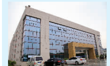
海安有色金属交割库结算中心