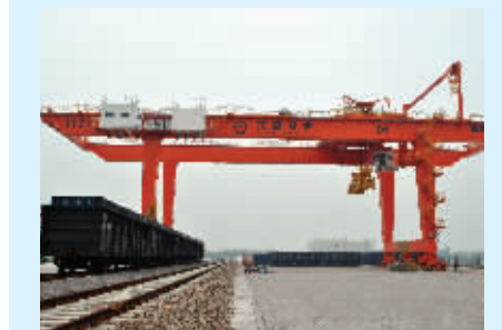
装载货物