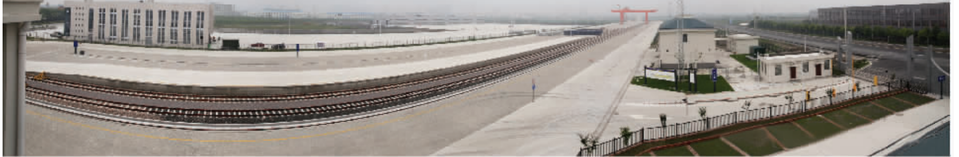
海安有色金属铁路线 除署名外均为资料图片