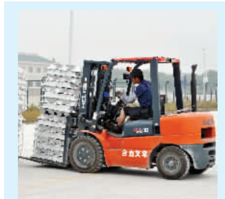
交割库堆场,工人正在用叉车码放铝锭