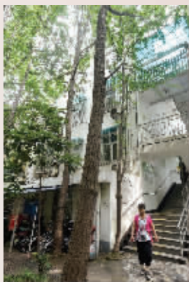
迷你养老院就在这栋小楼的二楼和三楼