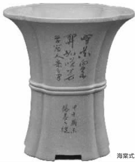
海棠式兰花盆(书法:张六弢)

1966年1月生于江苏宜兴。1984年至1992年在张渚工人文化宫工作,1992年至2011年8月在宜兴市总工会工作,现就职于江苏省国画院江苏省书法院,任江苏省书法院创作部主任。中国书法家协会会员,江苏省书法家协会理事,无锡市书法家协会艺术顾问,无锡市政协委员,宜兴市书法家协会名誉主席。