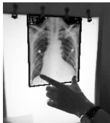
拍片显示,李某的心脏已占胸腔80%以上的空间