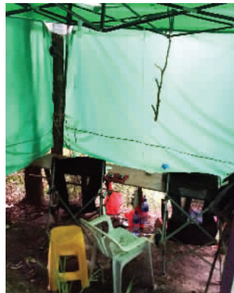
诈骗窝点内部，有好几个“工位”