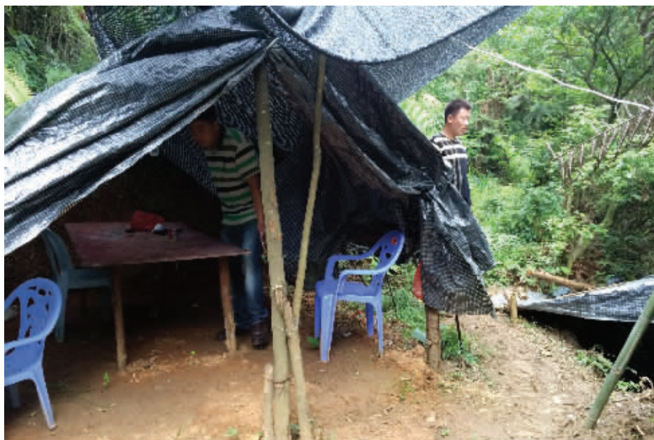
“淘宝哥”的诈骗窝点