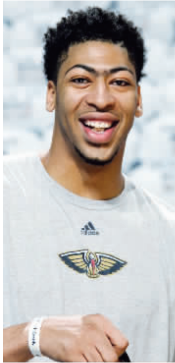
“浓眉哥”签下一纸肥约

而老将里德诺则不幸又被交易,雷霆将其送到了多伦多猛龙,这是他本周内第4次被交易。 现代快报记者 黄成宇