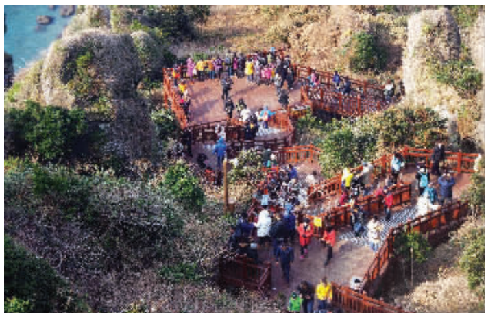
韩国旅游胜地济州岛

“ 韩国法务部1日发表声明说,为重振受中东呼吸综合征(MERS)疫情影响的旅游业,韩国将对来自中国和部分东南亚国家的团体游客免签证费,时间从7月6日至9月30日。