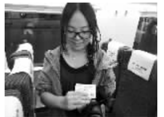
乘客展示高铁票

据高铁南京南站党总支书记严勇介绍,南京前往贵阳的高铁,沿途会经过镇江、常州、无锡、苏州、上海、杭州、南昌、长沙等地。全程运行时间为10小