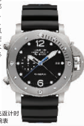
沛纳海 47毫米3日动力储备飞返计时 自动专业潜水钛金属腕表