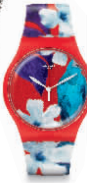
Swatch Mister parrot 鹦鹉先生腕表

一般的30米防水只是针对于日常的洗脸、洗手等小范围的溅水,不能长时间、深度地浸泡在水中。腕表遇到汗水变绿,是因为表厂采用镀金容易、颜色漂亮的铜金属包金电镀,但若镀金技术处理不好就会造成手表的氧化现象。现在钟表镀金普遍采用不锈钢电镀技巧,因此已经很少发现这种情形了。因此,建议夏季佩戴腕表最好不要选择皮带或者绢带,最好购买不锈钢或塑胶材质表款。