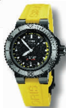
Oris Aquis 黄色水深测量表

所谓潜水表,顾名思义指的是:潜水用的时计表(经过防水、防潮处理,供潜水员使用的手表。一般的防水表并不能用以潜水。潜水表一定要符合严格的规定,并非防水性强就能叫做潜水表。简单地说:潜水表要有更高的防水性能,有便于在暗中海底读取时刻的夜光指针和刻度。虽然大部分的腕表都会具有基本的防水功能,但是即便如此,一旦进水,腕表内部的零件便会氧化,损害其正常的功能使用。因此一款合适的潜水表也是夏季海边旅行的必备法宝。