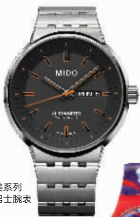
美度完美系列 特别款男士腕表