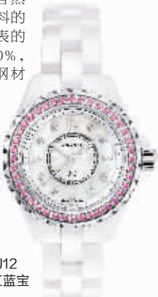
CHANEL 香奈儿J12 白色腕表镶嵌粉红蓝宝石 29毫米