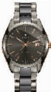
RADO瑞士雷达表 HyperChrome 皓星系列 等离子高科技 陶瓷自动机械腕表

高科技陶瓷,它是以二氧化锆为主的矿物粉末(粉末颗粒直径不足1微米)在1500℃左右的高温中烧结而成。它和中国传统的陶瓷制品一样,具有稳定的物理和化学性质,防水防高温防褪色抗腐蚀,且表面温润无瑕,能够散发柔美的自然光泽。与不锈钢材料的手表相比,陶瓷手表的重量减轻了大约60%,其硬度约为不锈钢材料的10倍,而且耐锈蚀和耐热性能好,具有高硬度,不怕水淋,不怕汗渍,不怕腐蚀,永不生锈。