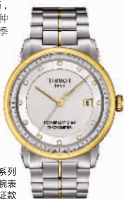
天梭豪致系列 自动机械腕表 天文台认证款