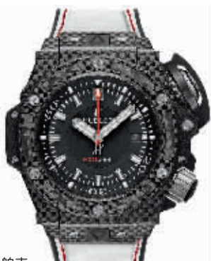
宇舶表 深海探秘 EXO4000米潜水表