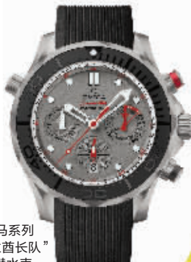
欧米茄 全新海马系列 “新西兰酋长队” 300米潜水表