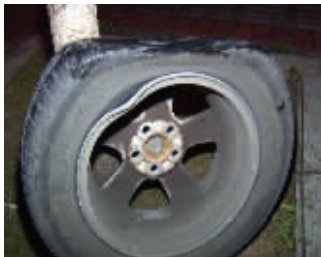
轮胎钢圈都撞变形了