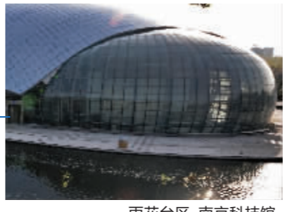
雨花台区·南京科技馆