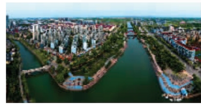
浦口区·城南河新貌