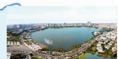
六合区·即将改造完成的龙池湖

全区有幼儿园和公办中小学60多所，各类教育普及程度达省教育现代化指标，基本普及了15年基础教育。在医疗卫生方面，全区共有政府办医疗卫生机构8个，其中，二级医院1个(即雨花医院)；公共卫生单位3个(即区疾病预防控制中心、区卫生监督所、区妇幼保健所)；社区卫生服务中心5个(即雨花、铁心桥、西善桥、板桥、岱山社区卫生服务中心)。