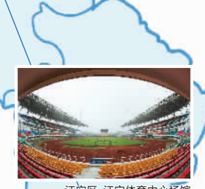
江宁区·江宁体育中心场馆