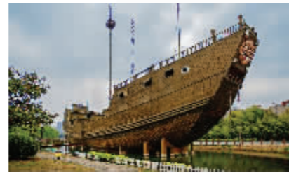
鼓楼区·宝船厂公园

湖生态环境绝佳，秦淮新河两岸风光怡人，是繁华大都市中最难得的一片“世外桃源”。在板桥新城，昔日的石闸湖已变身成为莲花湖公园，围绕1300亩湖面的是配套完全、功能完善的运动中心、休闲街区和商业商贸区。