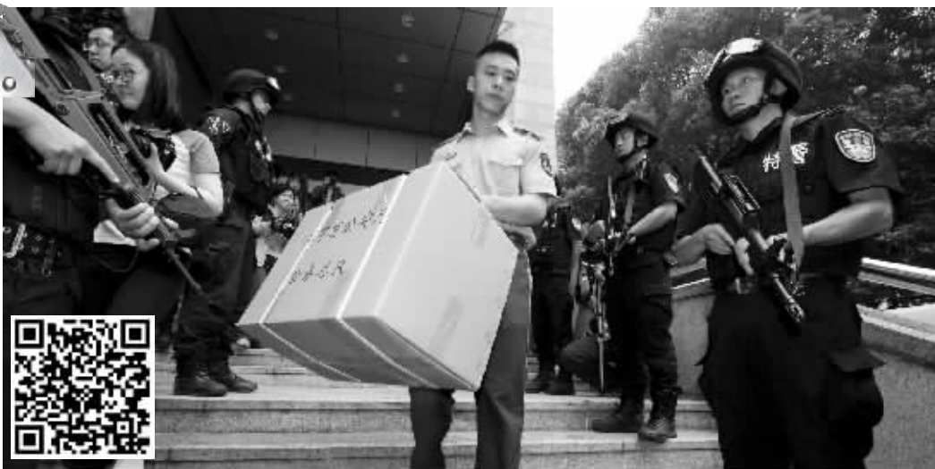
毒品开始装车 现代快报记者 邱稚真 摄 扫描二维码观看销烟全过程 现代快报记者 刘玉莹 拍摄/制作