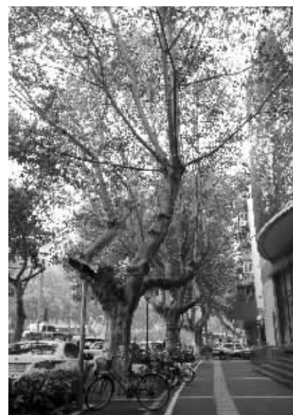
入夏,两棵法桐枝叶枯黄

昨天下午,鼓楼区市政设施综合养护管理所绿化科相关负责人告诉记者,这两棵法桐的栽种年代暂不可考。根据现场勘查情况,附近的法桐应该栽种于解放后,至少有三四十年的树龄。至于为何枝叶会在大雨后突然枯黄,相关调查仍在进行。不过,两棵法桐的主干部分并未死亡。进入梅雨季节,出于安全防范,绿化科已经向上级部门申请,对出现枯黄的两棵法桐将采取相关措施。