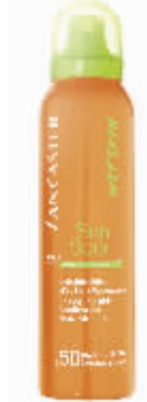
兰嘉丝汀沁爽隐形防晒喷雾

肌肤之所以能够呈现清爽通透的质感,是因为肌肤的纹理整齐细腻,能够很好地反射光线。反之,肌理一旦混乱,就如同凹凸不平的界面一般,致使光线反射的回路凌乱不堪。悦木之源绿茶CC添加了嗜热菌藻,能够转化生存环境中所含的大量有毒重金属。将肌肤中游离的自由基有效代谢,转化成营养水分,达到由内而外的清透净化效果。