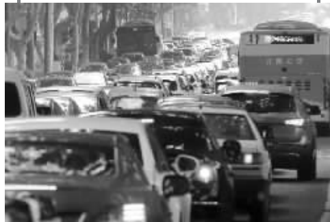
昨天,南京部分道路拥堵不堪