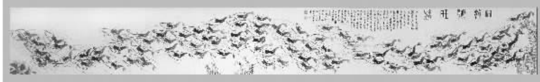
《百虾图》规格:15平尺 纸本水墨 市场价:27万 特惠价:4980元