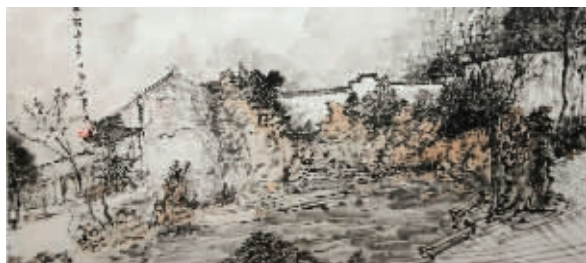
房汉陆《扬州何园写生之一》