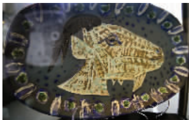
毕加索的《傲气的山羊》