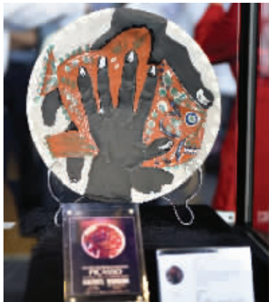
毕加索的《捧着鱼的手》