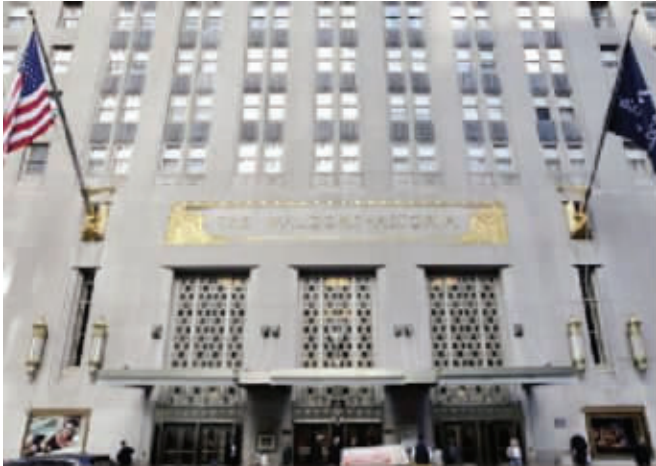
华尔道夫饭店大门口

美国国务院一些官员17日说,今年秋天联合国大会期间,美国国务院将放弃数十年的传统,不会入住纽约华尔道夫-阿斯多里亚饭店(也称华尔道夫饭店),而是另外选择一家饭店。美国国务院如此做法,或与华尔道夫饭店去年出售给中国企业有关。