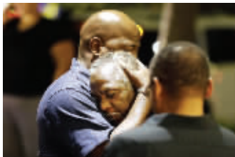
现场的人们互相安慰