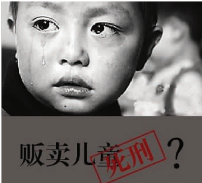
朋友圈里刷屏的这张图片很触动人心,网友支持“贩卖儿童判死刑”的占多数

“贩卖儿童一律死刑”引发热议,这是一场单纯的公益传播行为还是商业营销炒作,已经不重要。目前公众的焦点,不再是简单讨论“人贩子一律死刑”,而是深入到如何更好地保护儿童这个问题上。