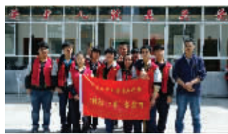
学生志愿者在赛虹桥社区养老院

到了极大的提升,使之成为学校德育工作的有效途径和重要载体,促进了学生德智体等综合素质的全面和谐发展,促进了德育目标的实现。