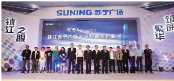
镇江苏宁广场全球招商发布会现场

6月16日,镇江苏宁广场召开全球招商发布会,包括卡地亚、Hugo Boss、UNIQLO、登喜路、阿玛尼等国际大牌,周生生、周大福、例外等国内知名品牌,以及各大餐饮、生活休闲等行业的400多个品牌高层悉数参加,见证“一站式精品时尚购物中心”镇江苏宁广场的盛大时刻。据了解,作为苏宁布局镇江商业的重要项目,镇江苏宁广场将重新改写大市口“核心”商圈的格局。值得关注的是,作为苏宁置业旗下的明星产品,目前苏宁广场已在无锡、福州、成都、石家庄、连云港、芜湖等地成功开业运营,今年还将有12个苏宁广场和苏宁生活广场开业。