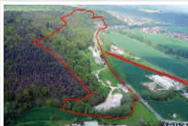
红线内就是避难所的大致范围