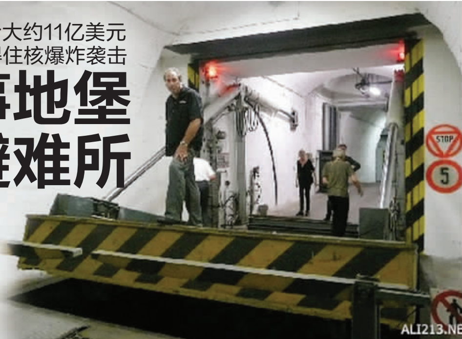
几吨重的钢门能防核爆

美国一家企业将德国东部一座老军事地堡“变废为宝”，打造成一座可防爆、防震、防海啸的豪华“末日避难所”。只是，要躲过“世界末日”要付出不小代价，恐怕只有巨富们才能买得起这样一张“诺亚方舟”船票。这座“五星级”避难所名为“欧罗巴一号”，由美国加利福尼亚州维沃斯公司建造，位于德国东部的罗滕施泰因村，主体本月12日竣工。