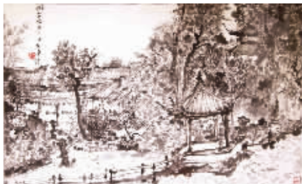
房汉陆《狮子林写生》