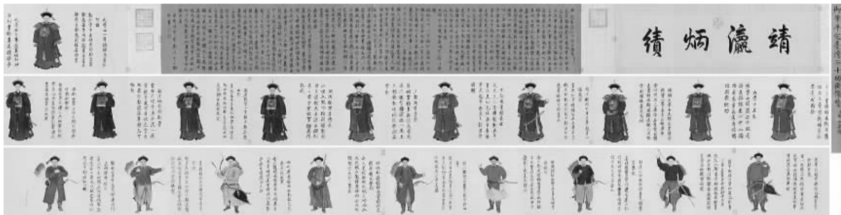
乾隆《御笔平定台湾二十功臣像赞》