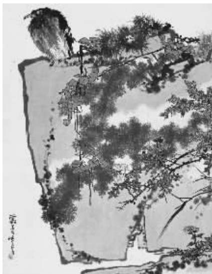
潘天寿《鹰石山花图》