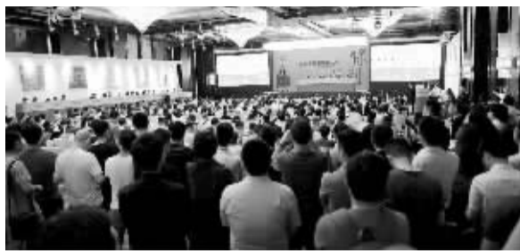
北京保利春拍现场