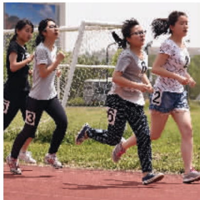
女生在进行800米长跑测试