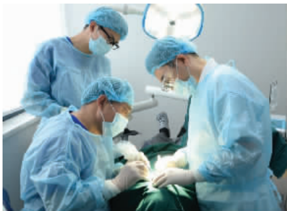
“种植牙推广工程”专家为患者亲诊