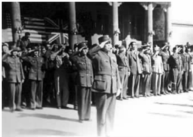
国民党第十一战区司令孙连仲在故宫太和殿接受日军投降