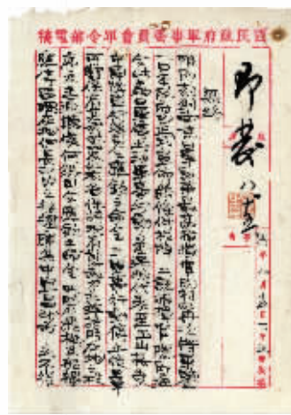
就受降事宜致日军电稿