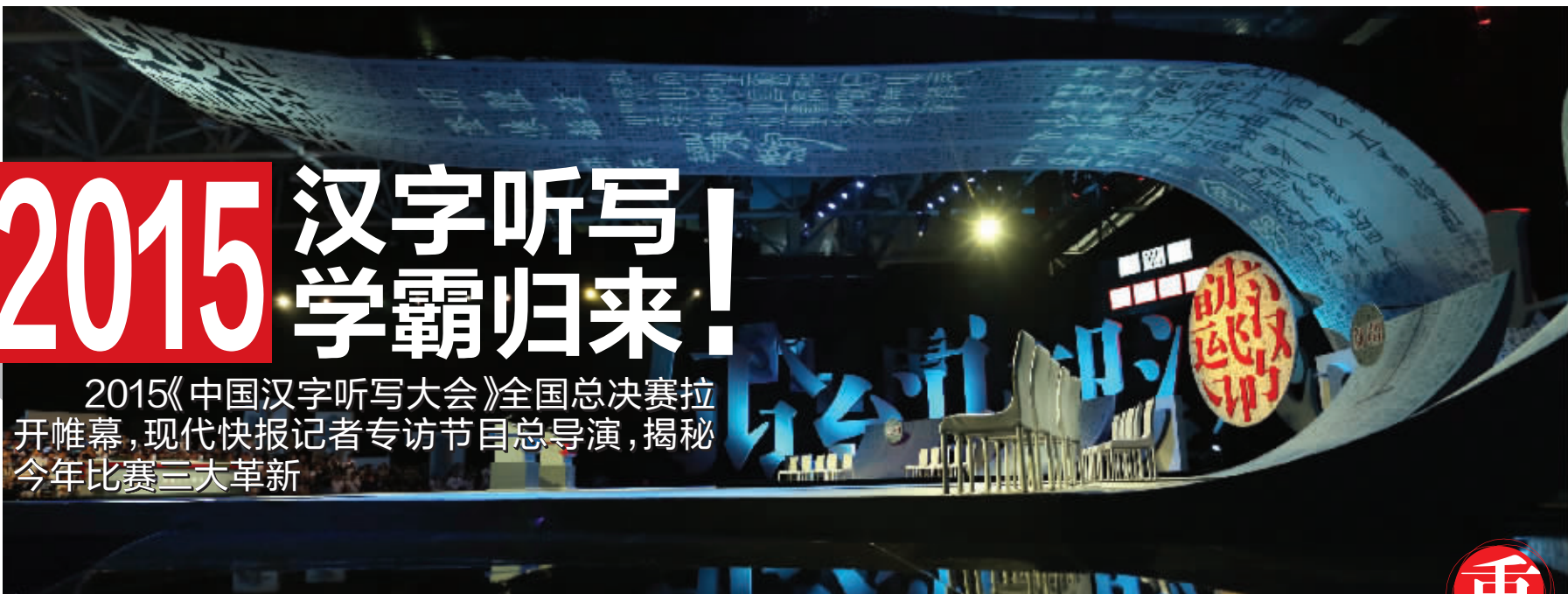
2015中国汉字听写大会录制现场

2015《中国汉字听写大会》全国总决赛拉开帷幕,现代快报记者专访节目总导演,揭秘今年比赛三大革新