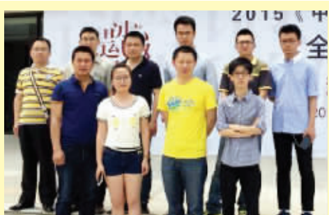
快报选拔的10名汉字达人