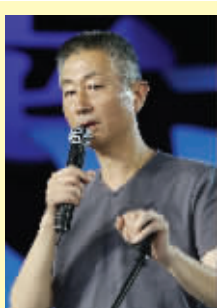
中国汉字听写大会总导演