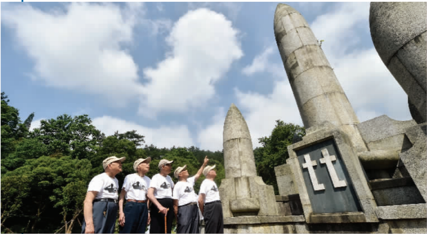
老兵们来到“七七”纪念馆前