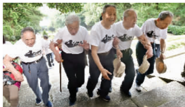
手挽手登上南岳忠烈祠