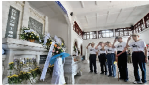
向抗日阵亡将士敬礼