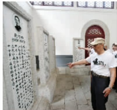
老兵找到自己的副师长