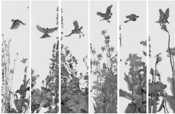
周京新《羽花蝶六条屏》