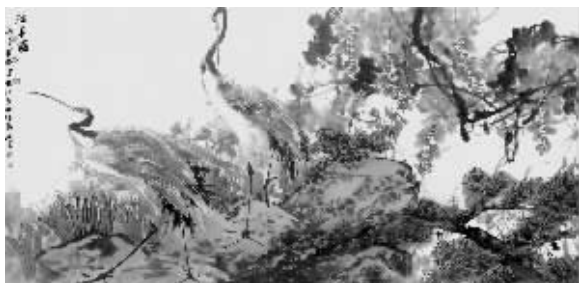
赵治平 王国斌 高建胜 张兴来合作《沐春图》