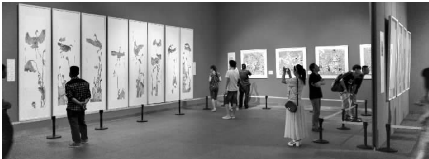
“金陵风骨·其命惟新——2015江苏省国画院作品展”现场