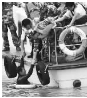
据人民日报客户端

为纪念中华人民共和国成立 66 周年和抗日战争胜利 70 周年 首次以历届开国大阅兵、六大伟人、十大元帅、十大将军,以及各开国将领和十四大抗日事件(七七事变、血战台儿庄、百团大战、日本无条件投降等十四个历史事件)首次以永恒纪念这一历史时刻!