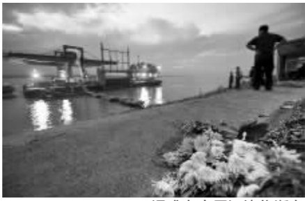
遇难者家属江边祭逝者