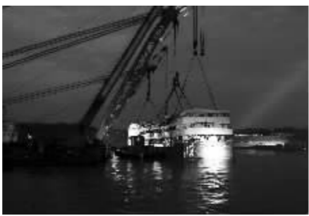
搜救人员进舱作业