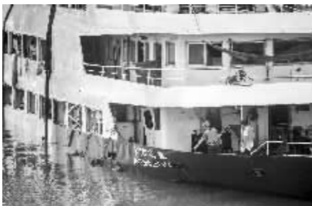
工作人员进行甲板下舱室抽水作业