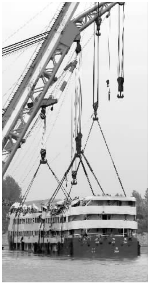
救援人员将“东方之星”缓慢吊出水面