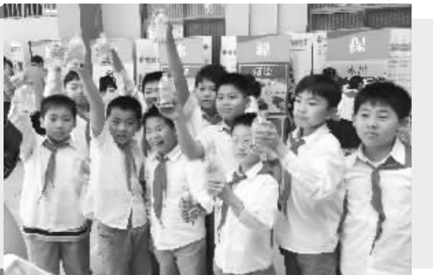
小学生们自己动手,在矿泉水瓶里打造水世界