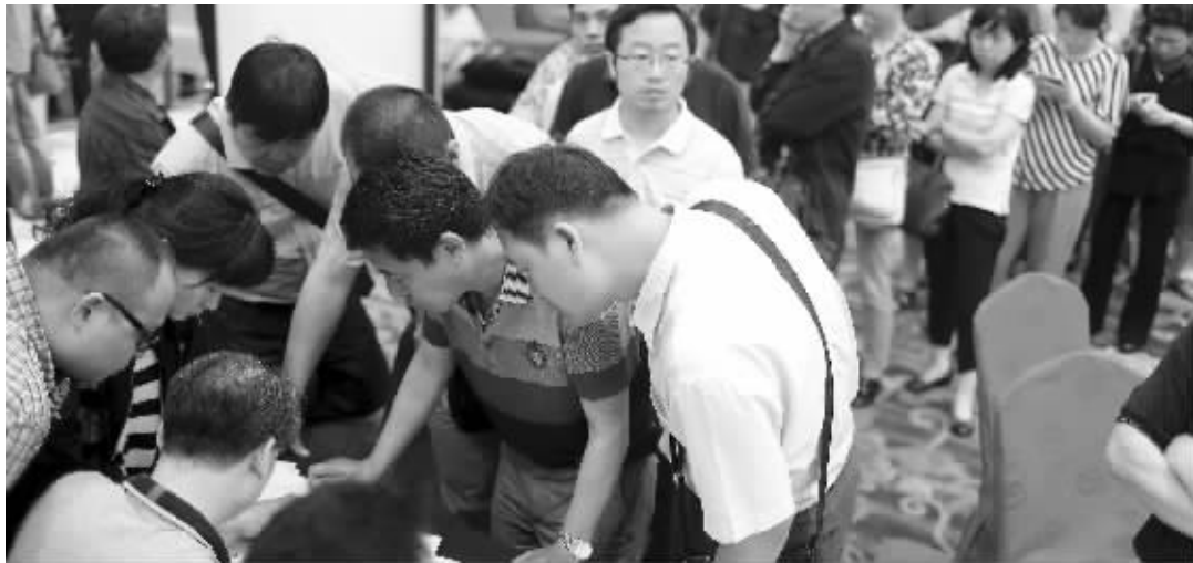
东方之星游轮乘客家属在进香河世纪缘酒店临时接待点登记亲人的信息

截至晚上8点10分,101名南京游客的家属已全部联系到,并完成了信息登记工作。目前在接待点进行信息登记的共有109名游客的家属,除南京的101名游客家属外,还有4人从苏州旅行社报名、两人从镇江旅行社报名和两人从安庆旅行社报名。