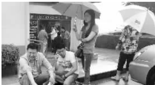
家属在五马渡广场等消息