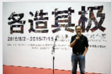
江苏省国画院名誉院长赵绪成致辞