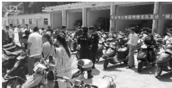
特警支队集中发还查获的被盗电动车

同时警方还建设了一批新型警务工作服务站作为街面屯兵点、警务交接点、便民服务点,实行24小时