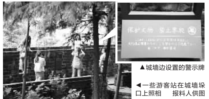
▲城墙边设置的警示牌