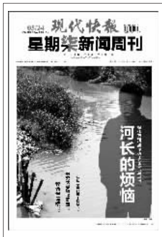
(上期星期柒新闻周刊封面)