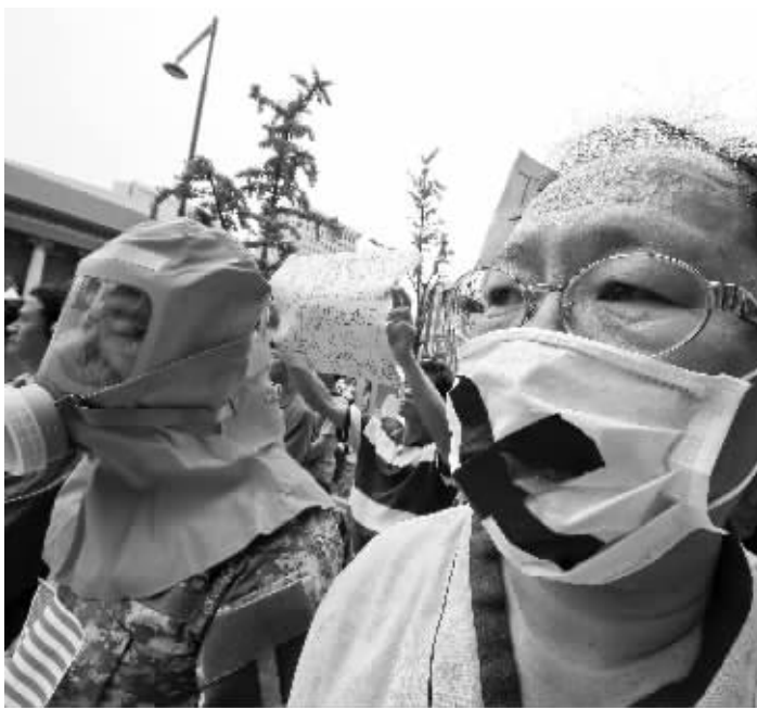
韩国民众在美国大使馆前示威,抗议美国国防部将活性炭疽样本运送至韩国美军基地

美国国防部29日已经下令,要求由国防部负责采购、技术和后勤的副部长弗兰克·肯德尔牵头,对军方实验室灭活炭疽杆菌的操作过程展开全面审查。