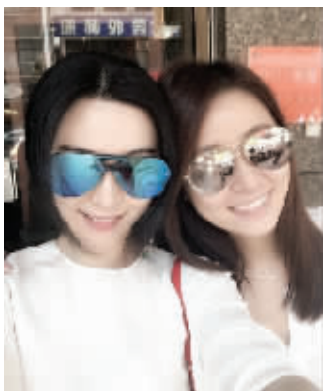
林心如晒与范冰冰合影

李晨、范冰冰在公布恋情时使用的“我们”两字,以及合影成为昨天微博最流行的范本。众多网友纷纷贴出自己与爱人、友人的合影,配上“我们”两字,玩得不亦乐乎。众多明星也加入了“我们”行列。姚晨贴出自己与儿子的合照,用爱心标注“我们”。林心如晒出了自己与范冰冰的合影,并@赵薇,呼唤“我们,约吗?”赵薇立即回复:“你们真潇洒,我还在片场拍戏呢,等我拍完我也要潇洒一下,祝你@林心如快点找到男票!”这三位当年的《还珠格格》女主角在微博“隔空合体”,让网友感慨万千:“暑假快到了,又可以看《还珠格格》了。”