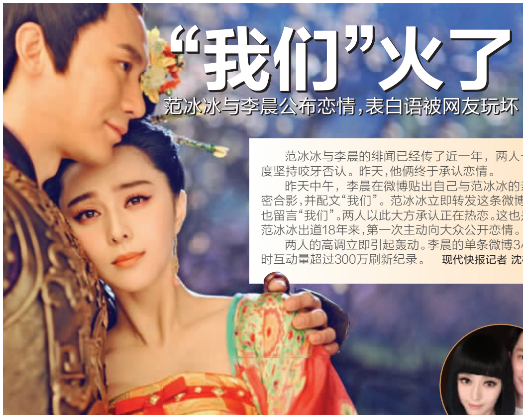
▶ 范冰冰与李晨的“我们”合影走红微博

两人的高调立即引起轰动。李晨的单条微博3小时互动量超过300万刷新纪录。现代快报记者 沈梅