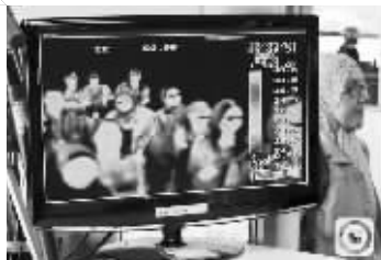
5月21日,韩国仁川国际机场,热感预检监视器显示海外入境旅客体温

中东呼吸综合征病毒之后在中东等地传播,欧洲、非洲、亚洲、美洲等20多个国家陆续出现疫情和医务人员感染。中东呼吸综合征与2003年肆虐的非典同属冠状病毒,其传染性不及非典,但病死率比非典高。根据目前已知的病毒学、临床和流行病学资料,中东呼吸综合征冠状病毒已具备有限的人传人能力,但无证据表明该病毒具有持续人传人的能力。