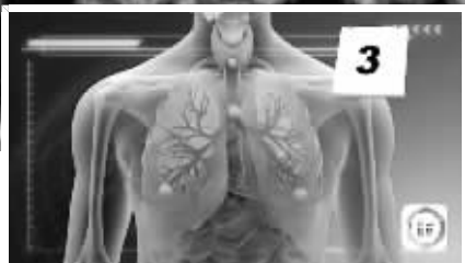
中东呼吸综合征冠状病毒图像