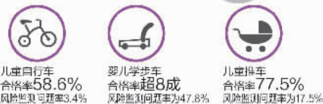
制图 沈明