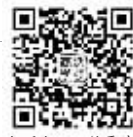
扫码也可以约票哦

【浙江大学】浙江大学是我国首批985、211重点名校,2014年已在无锡地区开设金融学在职研究生班,80余名同学参加学习。2015年浙江大学在无锡地区招收在职研究生专业有管理学专业企业管理方向(目前报名人数已过半),经济学专业金融学方向,法学专业民商法学、公司金融法学方向。招生对象:本科毕业满两年以上可免试入学,无锡教学中心电话:0510-82720993