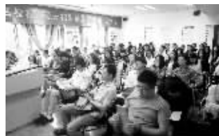
图为南京站讲座一角

还在为选择本地院校还是外地院校犹豫?还在为选择MBA还是单证在职研究生纠结?——本周日下午,全国名校在职硕士2015年大型联展咨询会将在无锡地区开幕!据称,自发布相关消息后,仅三天时间,预约门票人数已超过百人!