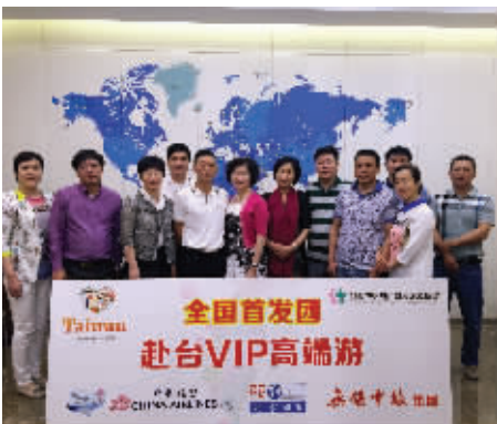
首个赴台VIP高端团一行12人昨从无锡首发